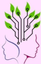
Figura 1 – Divulgação

Se a resposta anterior for SIM, como você conheceu o Emílias Podcast?